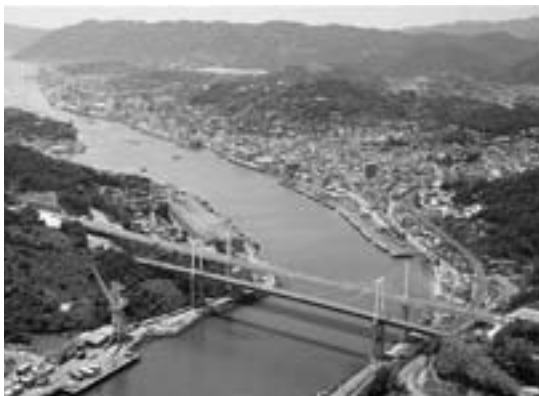
尾道水道と尾道の街並