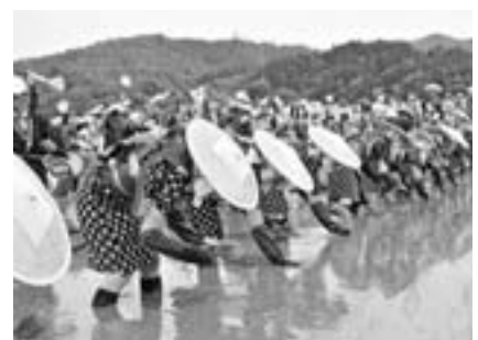
ユネスコの無形文化遺産「壬生の花田植」