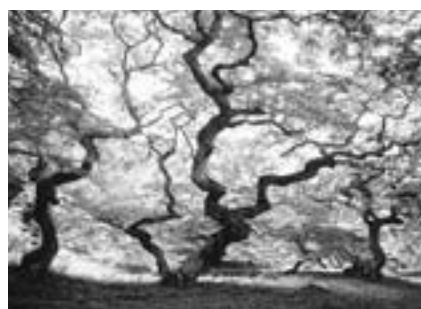
大朝のテングシデ群落