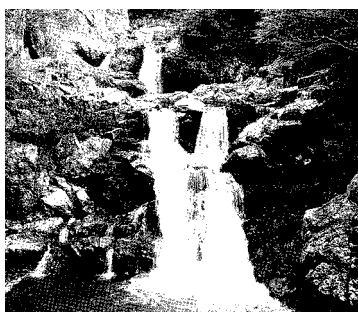
国特別名勝三段峡「三段峡」