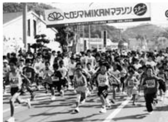
ヒロシマMIKANマラソン