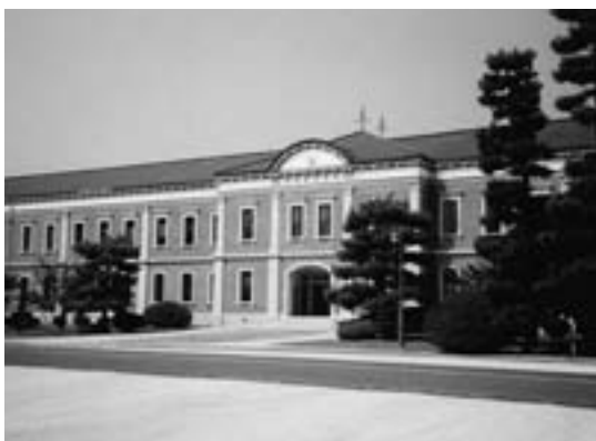
海上自衛隊第1術科学校